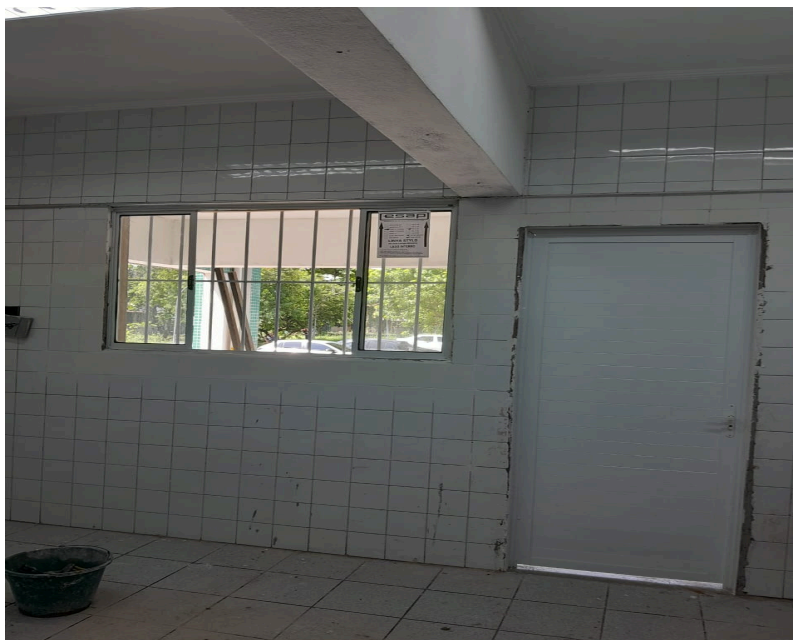
Figura 5 - Iluminação