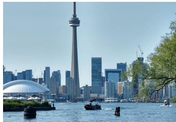
Vista de Toronto - Canadá

Mais informações em: https://www.ifsp.edu.br/images/2022/10_Outubro/Edital_597_2022_de_17_de_outubro_d_e_2022_Ingles_Geral_assinado.pdf .