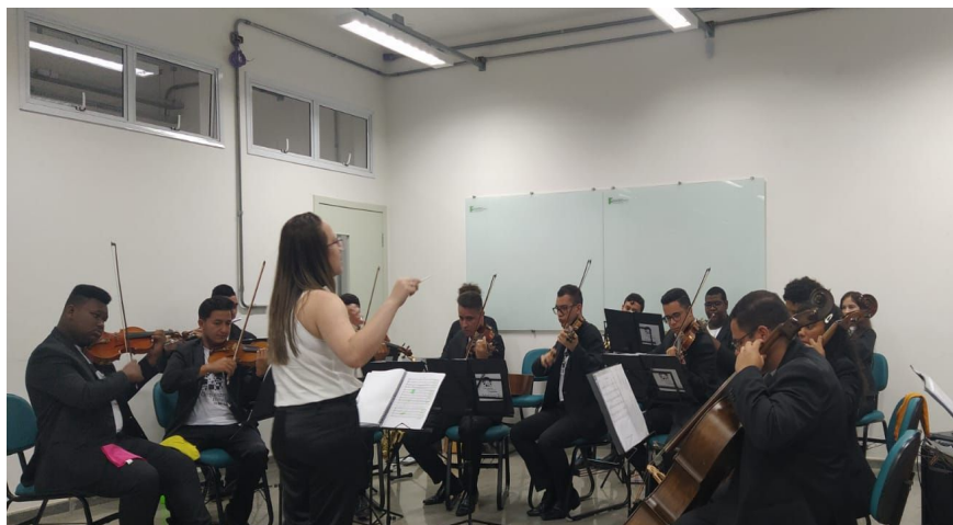
Apresentação da Orquestra Sinfônica de Itaquaquetuba na SNTC

Realizada entre os dias 19 e 21 de outubro, a Semana de Matemática teve o intuito de promover o ensino e a aprendizagem da matemática entre tutores, professores, estudantes e a comunidade ao redor. Nesses três dias, os alunos do campus tiveram a oportunidade de participar de atividades como competição de Sudoku, oficinas, minicursos, jogos matemáticos e apresentações de trabalhos de alunos.