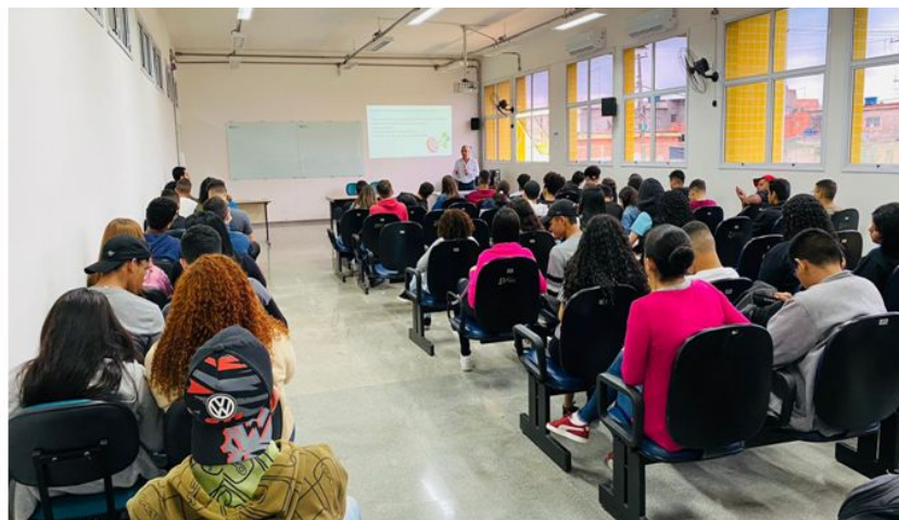
Palestra da 1ª SEMEC