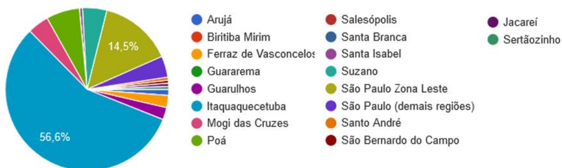
Figura 2 –Local de residência das pessoas que responderam a Consulta Pública Virtual.

Ao questionar o local de residência, 56,6% (94 pessoas) das respostas são de pessoas que dizem morar em Itaquaquecetuba; 14,5% (24 pessoas) moram em São Paulo (Zona Leste); 6,6% (11 pessoas) em Poá; 4,8% (8 pessoas) em Suzano; 4,2% (7 pessoas) moram em Mogi das Cruzes; 4,2% (7 pessoas) São Paulo (demais regiões); 2,4% (4 pessoas) em Guarulhos; 2,4% (4 pessoas) em Ferraz de Vasconcelos; 1,2% (2 pessoas) em Arujá; e 3,1% (5 pessoas) das repostas correspondem as cidades de Santo André, São Bernardo do Campo, Jacareí e Sertãozinho, cada uma, respectivamente com 0,6% das repostas. A Figura 2 demonstra de forma visual os dados apresentados.